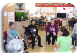
通所介護(デイサービス)