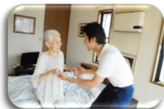
訪問リハビリテーション 訪問看護