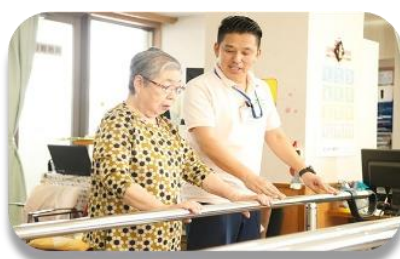
外来リハビリテーション 短時間通所リハビリテーション