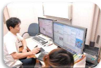
外来診療 訪問診療

山王リハビリ・クリニックのサービスの特徴は、リハビリテーション科専門医を中心としたリハビリ専門チームが一体となって、疾病の予防から在宅での看取りまで一貫して、患者さまご利用者さまの暮らしをより良くすることに関わり続けることです。