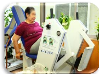
疾病予防型 メディカルフィットネス