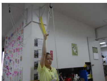
プーリー(肩関節の訓練)

生活動作に 関する訓練 各種訓練があり ます。 自身の目標に向 かって共に頑張 りましょう。